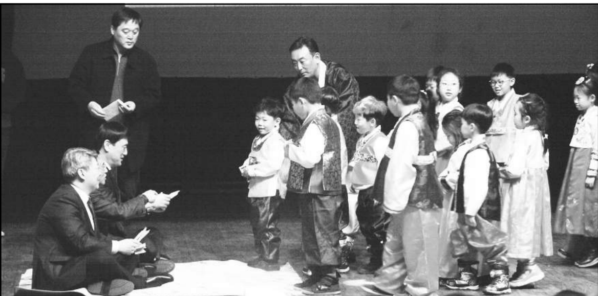
<교민자녀들로 부터 세배를 받은 내빈들이 어린이들에게 세배돈을 주고 있다.>