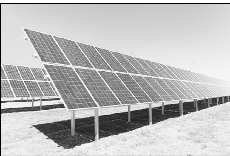
<카자흐스탄이 중앙아시아 최대 규모의 태양광 발전소를 완공하는 등 신재생에너지 개발사업에 박차를 가하고 있다.>

중앙아시아 자원부국 카자흐스탄에서 역대 최대 규모의 태양광 발전소가 처음으로 가동됐다. 이 거대한 태양광 발전소는 카자흐스탄 석탄산업의 심장부인 카라간다주에 들어섰다. 석탄·석유·가스 매장량이 풍부해 녹색에너지 개발을 미뤄오던 카자흐스탄이 신재생에너지 시대를 연 셈이다.